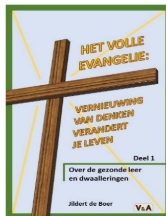
Omslagontwerp: Henk Verbeek

Het is mijn passie om in spreken en schrijven de boodschap die ons lief is te verspreiden. Het boek verschijnt onder het label 'Verdieping en Aansporing' (V&A) en is het eerste deel van een geplande serie die we - zo de Heer wil en wij leven - de komende jaren uit hopen te brengen. We hopen dat het in eigen kring een