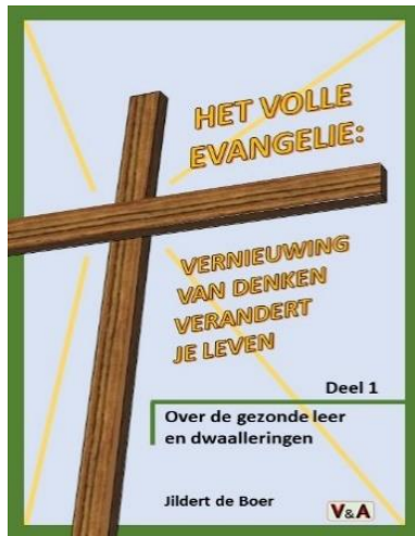
Omslagontwerp: Henk Verbeek

De uitdrukking ‘volle evangelie’ mag dan wellicht wat pretentius klinken, wat wordt bedoeld is het volledige evangelie naar de gezonde leer van het nieuwe testament. Het is de bedoeling dat het evangelie in al zijn volheid gebracht wordt. Dat reiken we aan te midden van veel religieuze verwarring, geestelijke oppervlakkigheid en eerlijkheidshalve ook halve waarheden, menselijke tradities en - niet te vergeten - leringen van demonen (1 Tim. 4:1). Ons wordt opgeroepen goed te onderscheiden wat zich aandient in de hemelse gewesten, om een echt christenleven te leiden in geest en waarheid als hemelburgers op aarde.