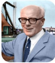
(klik de foto voor info)

Paulus spreekt opnieuw de hele gemeente aan. Hij zegt: 'Blijf bidden!' Zoals hij ook de Efeziërs aanmoedigt: 'bidt daarbij met aanhoudend bidden en smeken bij elke gelegenheid' . (Ef. 6:18). Bidden betekent actief zijn in de hemelse gewesten. Daar vinden we kracht, vreugde en vrede. Daar is onze gemeenschap met de Heer. Daar voeren we onze strijd tegen de boze geesten en van daaruit bekijken we de situaties, waarmee we hier op aarde in aanraking komen. De apostel spoort aan om door te gaan met bidden, dat wil zeggen, niet over te schakelen naar een andere, aardse visie of naar natuurlijke oplossingen. Hij spoort ook aan om waakzaam te zijn: 'daartoe wakende met alle volharding en smeking voor alle heiligen' (Ef. 6:18). Dat wil zeggen dat we de boze in de gaten moeten houden en onze zintuigen moeten trainen in het onderscheiden van geesten, van goed en van kwaad, zodat we de boze tijdig uit ons eigen leven kunnen weren en ook op de bres kunnen staan voor onze kinderen en voor onze broeders en zusters. We lezen met de 'Korte Verklaring': 'Weest waakzaam daarbij met dank!' Elk kind van God heeft overvloedige redenen om dankbaar te zijn voor zijn redding, verlossing, vervulling, genezing en voor iedere overwinning die in de hemelse gewesten is behaald. Ook bij onze