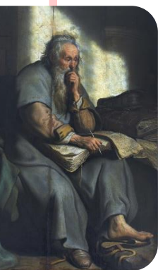
Paulus in de gevangenis

het Koninkrijk der hemelen en het plan van God - en deze dan uit te voeren en voort te zetten.